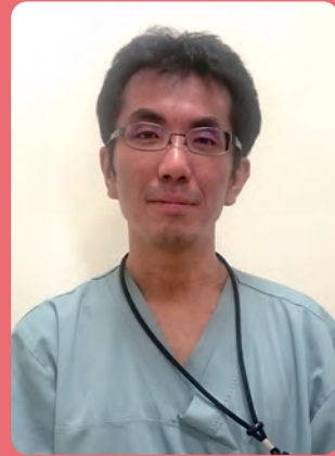
沖縄医療生活協同組合 沖縄協同病院 小児科 部長

「食物アレルギー事前調査票」が作成されました。積極的に活用していただくと幸いです。しかし、どんなに気を付けていても誤食が起こることはあります。万が一症状が出た時は、救急病院を紹介してください。息苦しそうにしていたり、ぐったりしているときは、救急車を呼んで下さい。沖縄に来てくれる修学旅行生全員が、楽しい思い出だけを持って帰れるように、また沖縄に来たいと思ってもらえるように、一緒に協力していきましょう！