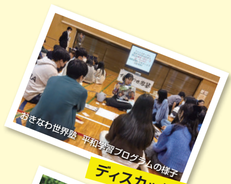
ディスカッション