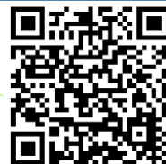
陽性者登録センターHP