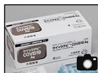
添付イメージ（製品名）