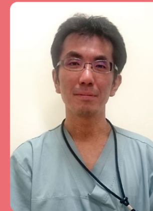
沖縄医療生活協同組合 沖縄協同病院 小児科 部長

「食物アレルギー事前調査票」が作成されました。積極的に活用していただけると幸いです。しかし、どんなに気を付けていても誤食が起こることはあります。万が一症状が出た時は、救急病院を紹介してください。息苦しそうにしていたり、ぐったりしているときは、救急車を呼んで下さい。沖縄に来てくれる修学旅行生全員が、楽しい思い出だけを持って帰れるように、また沖縄に来たいと思ってもらえるように、一緒に協力していきましょう！