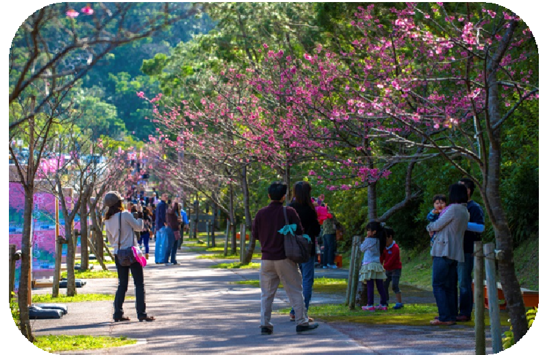
本部八重岳桜まつり

10月には「ミーニシ」と呼ばれる北東の季節風が吹き始め、沖縄にも短い冬が訪れます。